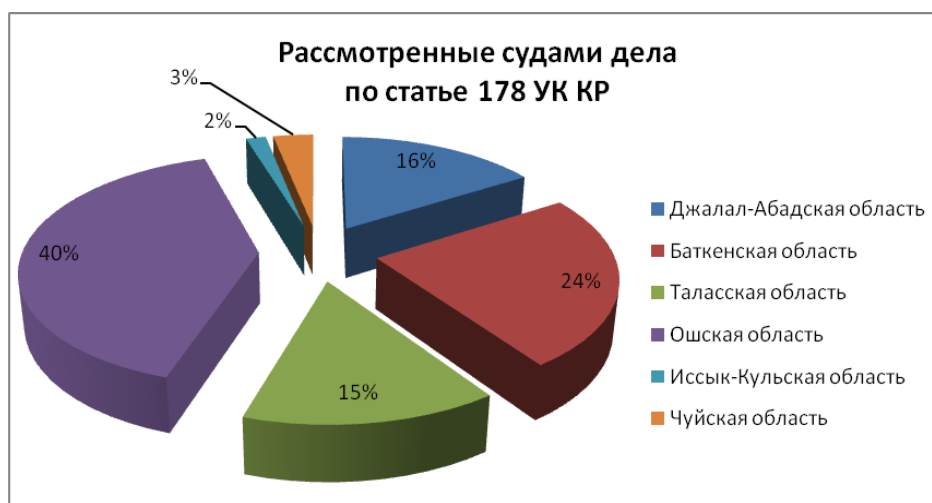
Диаграмма 1. Судебные дела по ст.178 УК в разрезе областей

Впервые мы сравнили показатели совершения преступлений по ст.178 УК в городах и сельской местности, чтобы оценить социально- культурный уровень лиц, совершающих такие